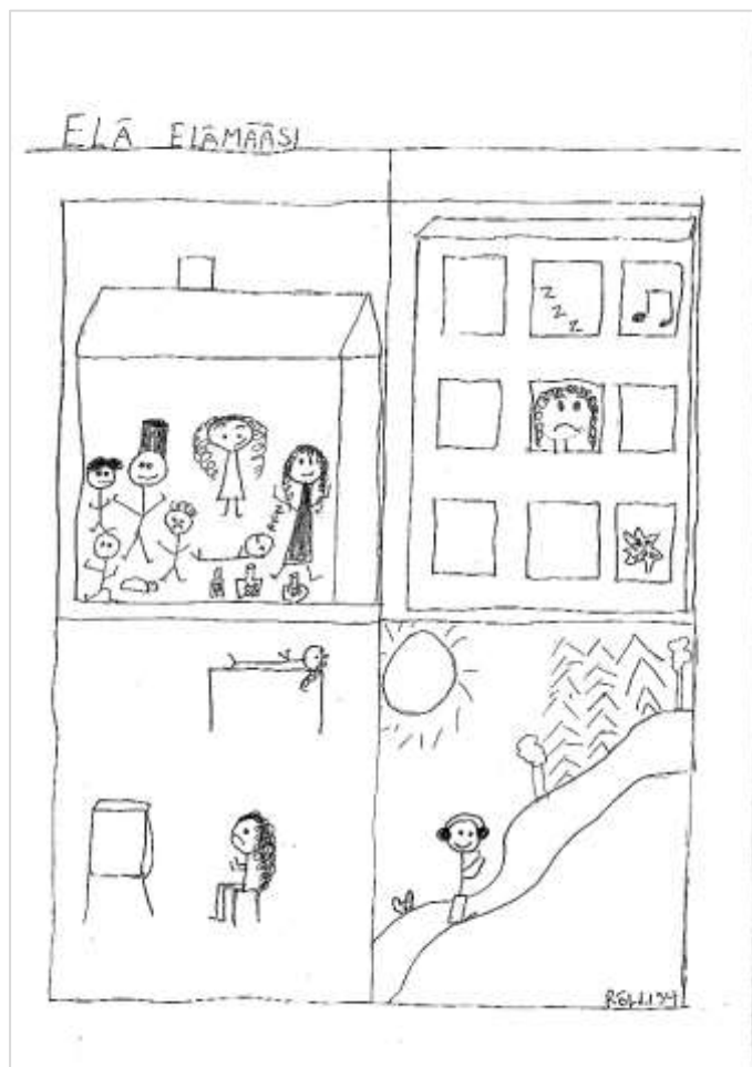
Kuva 1. Yksi sarjakuvatyöpajan tuotoksista